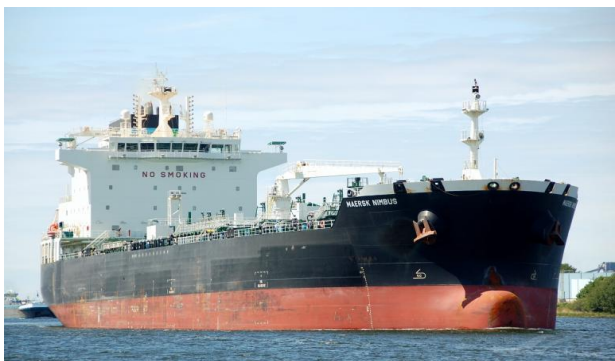
En lidt større model; Mærsk Nimbus

Jørn har sendt regnskab og opkrævning ud, så økonomien skulle være på plads